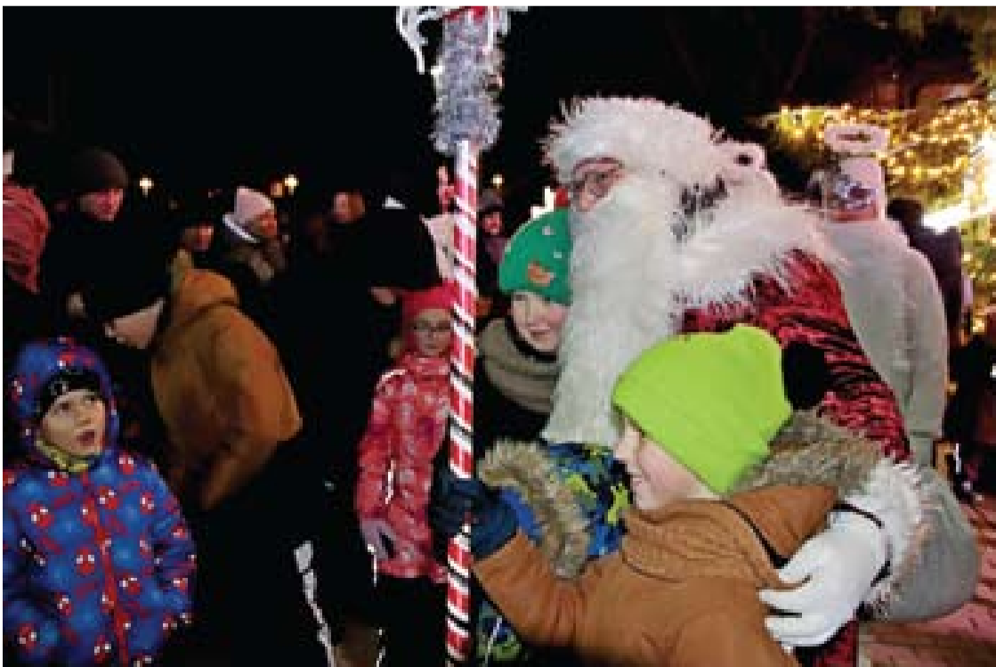
Prie Kalėdų senelio vaikučių netrūko.