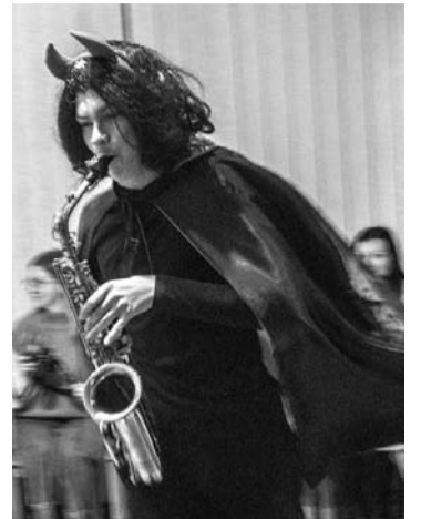
Vaikučius „gąsdino“ velniukas.

Šv. Mikalojus su sniego karaliene įsikūrė A. Vienuolio-Žukausko memorialinio muziejaus namo svetainėje. Joje, kaip ir gyvenamam namo šeimininkui esant, ant to paties kabljo palubėje kabėjo išpuošta gražuolė eglutė. Pirmieji į šv. Mikalojaus rezidenciją atvyko beveik dvi dešimtys ukrainiečių vaikų iš Kupiškio. Jūs pasitikusi Sniego karalienė kiekvienam iš delno davė pūsti snaigių, kad kelias šv. Mikalojui būtų baltas. Čia į kambarį dar įsiveržė juodas, raguotas velniukas su saksofonu, staigiais judesiais „gąsdinęs“ vaikus, tačiau greitai buvo išvytas. Į svetainę žengė linksmas, guvus ir vikrus šv. Mikalojus. Ukrainiečių kal-