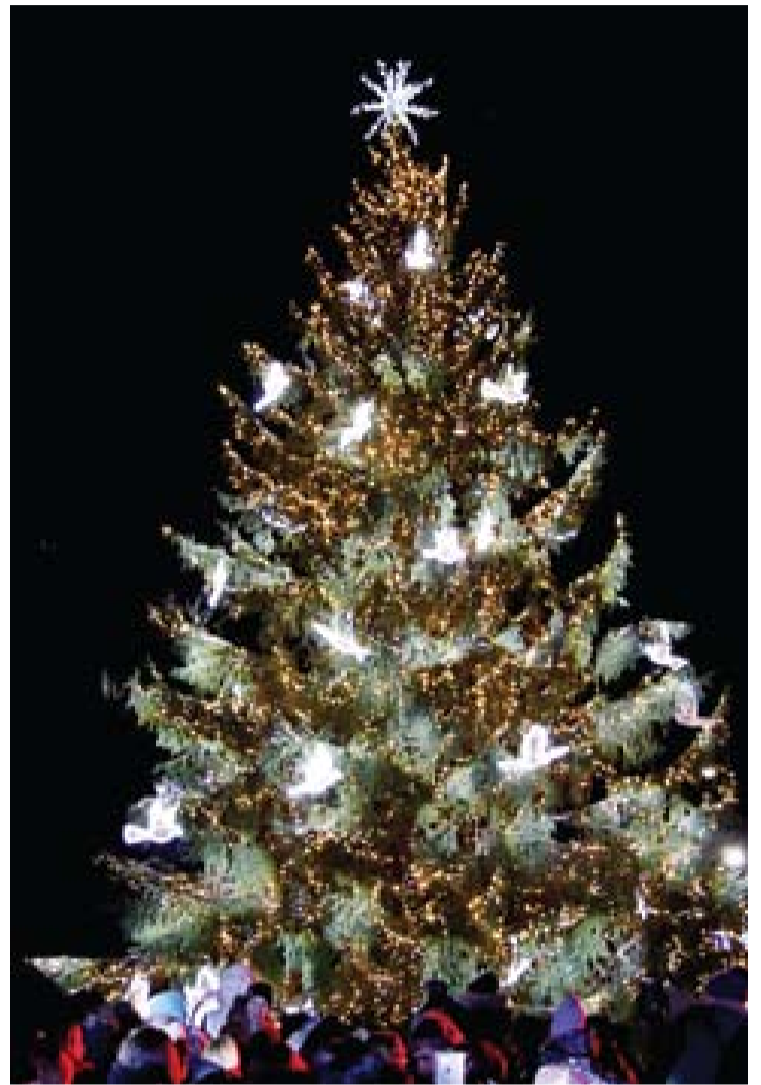
Anykščių eglutė įžiebta.