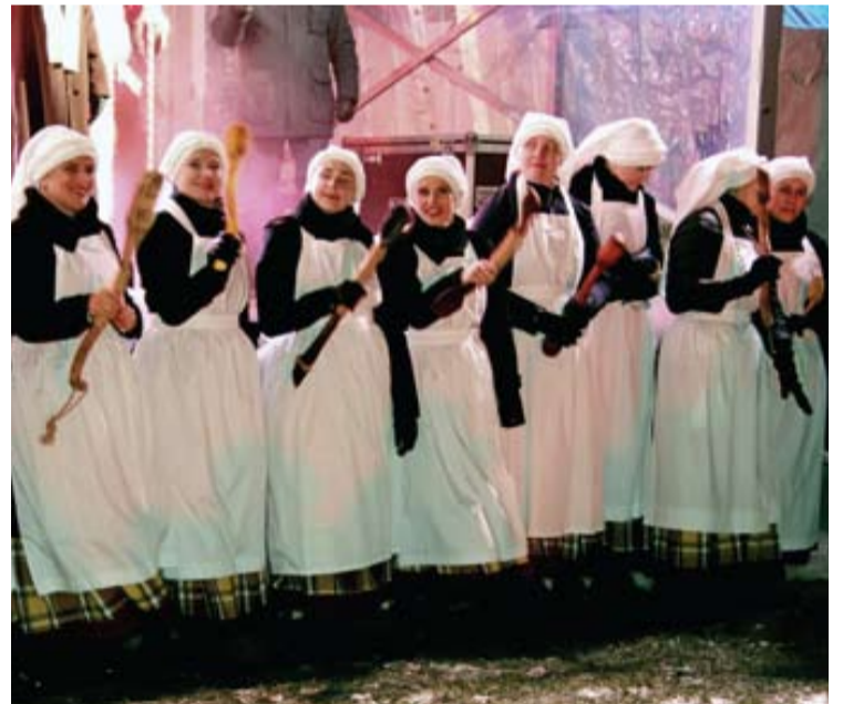
Linksmosios virėjos iš Baltosios planetos.