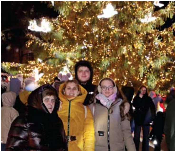
Žiūrovai pozavo prie eglutės.

Laimės ir džiaugsmo Jums, mieli anykštėnai! Gražaus ir ramaus švenčių laukimo! Iki naujų, netikėtų susitikimų!