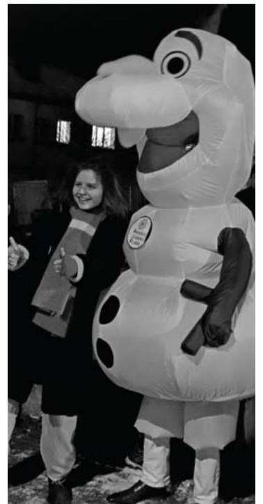
Fotosesija su seniu besmegeniu.