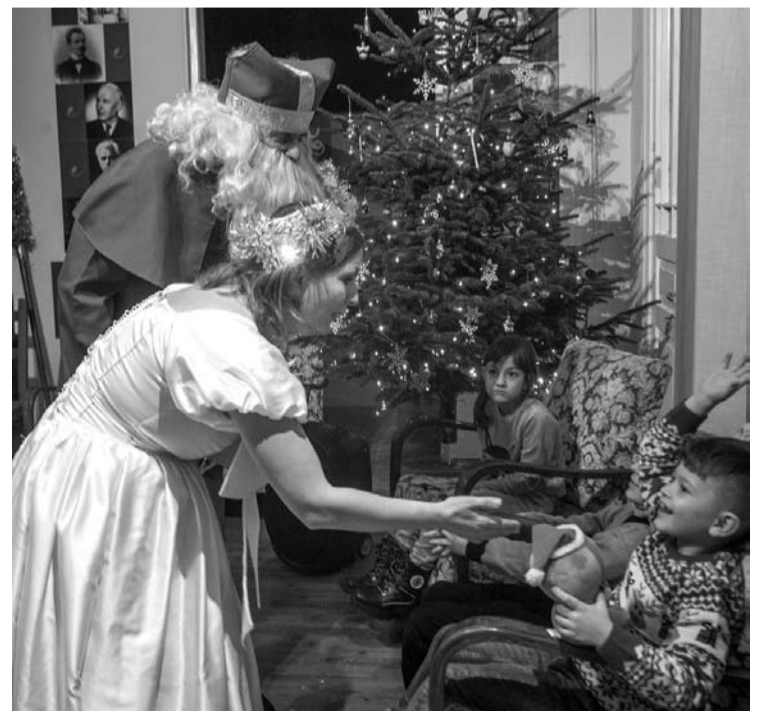
Ukrainiečių vaikams iš Utenos buvo linksma su šv. Mikalojum ir Sniego karaliene.

Padovanok „Anykštos“ ir „Aukštaitiško formato“ prenumeratą, ir Jus atsimins visus metus