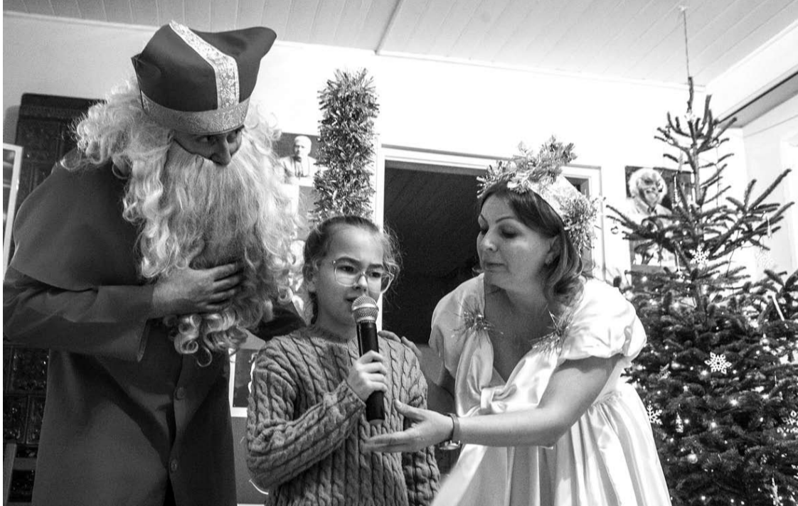
Šv. Mikalojus ir Sniego karalienė A. Vienuolio-Žukausko svetainėje. Vaikai sakė eilėraštkus.

Penktadienį, gruodžio 6 dieną, Anykščių Antano Baranausko ir Antano Vienuolio-Žukausko memorialiniame muziejuje veikė šv. Mikalojaus rezidencija. Į ją atvyko nuo karo pabėgusių ukrainiečių pirmų, antrų klasių vaikai iš Kupiškio, Utenos ir Anykščių rajonų. Pirmą kartą Lietuvoje tokia Anykščių muziejinių organizuota šventė vyko ukrainiečių kalba. Rezidencijoje apsilankė šešios dešimtys ukrainiečių vaikų.